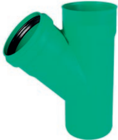
DN/OD 630 Abzweig ohne Muffe